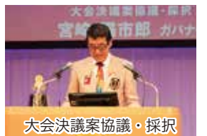
大会決議案協議・採択