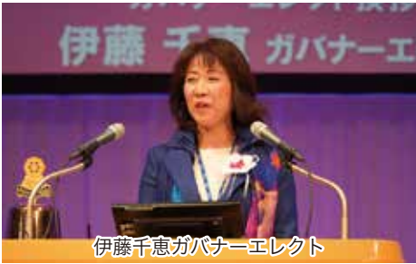
伊藤千恵ガバナーエレクト