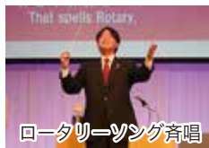
ロータリーソング斉唱