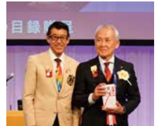
寄付の目録贈呈 (ロータリー財団・米山記念奨学会・バギオ基金)