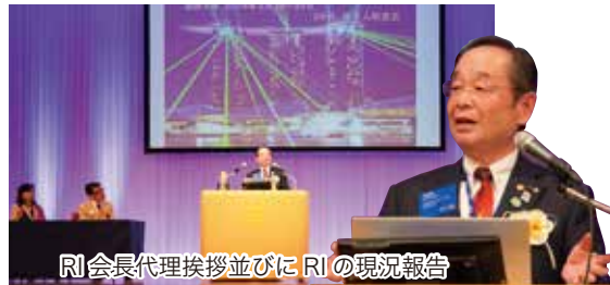
RI会長代理挨拶並びにRIの現況報告