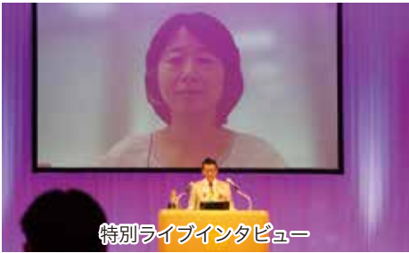
特別ライブインタビュー