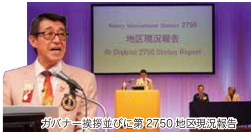
ガバナー挨拶並びに第2750地区現況報告