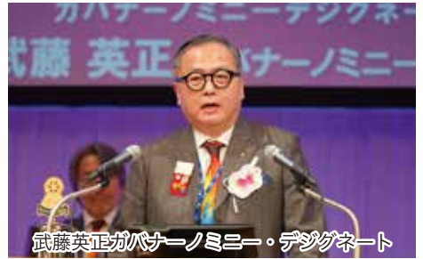
武藤英正ガバナーノミニ・デザイン