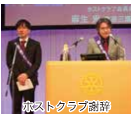
ホストクラブ謝辞