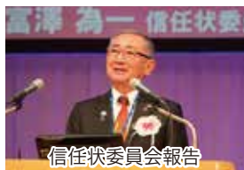
信任状委員会報告