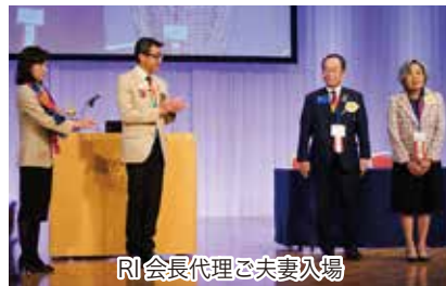
RI会長代理ご夫妻入場