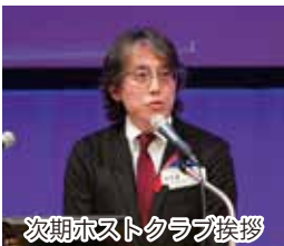
次期ホストクラブ挨拶